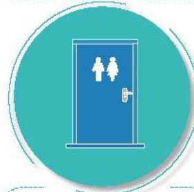
Después de tocar pasamanos o manijas de puertas