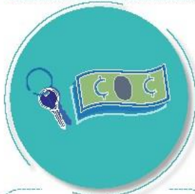
Después de tocar dinero o llaves