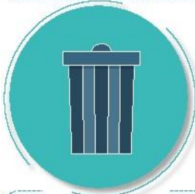
Después de tirar la basura