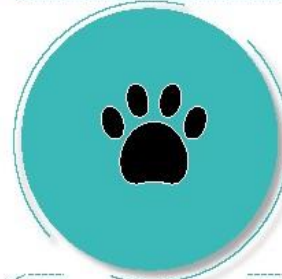
Después de estar con mascotas