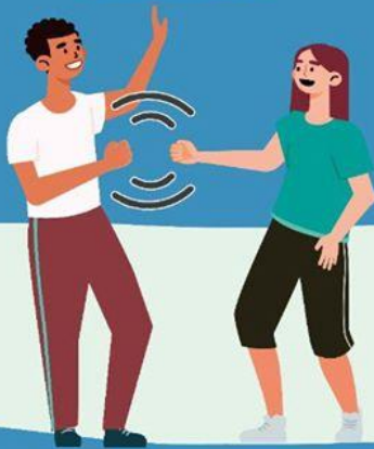
CON EL PUÑO DE LEJOS