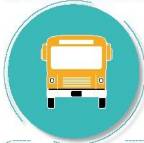
Después de utilizar el transporte público