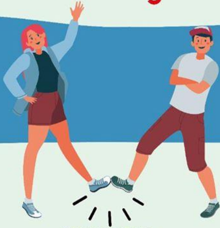
CON EL PIE