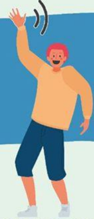
AGITANDO LAS MANOS